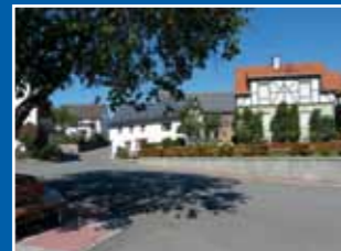
Rhenege – Straßenbau Schützenplatz/Tränke