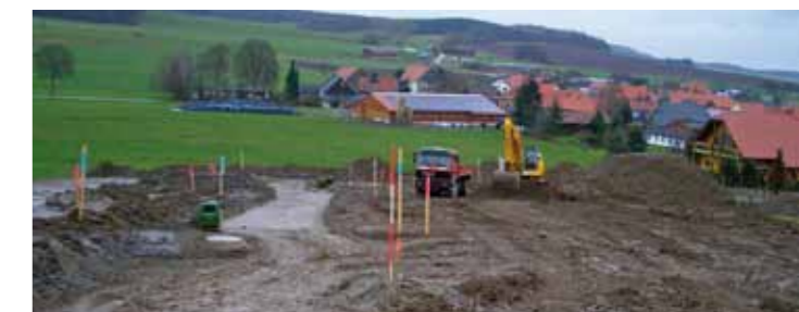
Erschließung Baugebiet Sudeck

Mit allen örtlichen politischen Vertretern sowie den Vereinen, Verbänden besteht eine gute Zusammenarbeit. Diese möchte ich sachorientiert, vertrauensvoll, fair und unparteiisch zum Wohle aller Bürgerinnen und Bürger weiterführen.