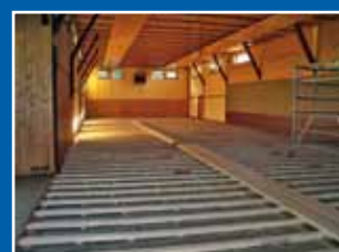
Sanierung Wirmetalhalle in Wirmighausen