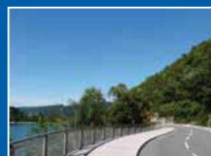
Neuer Rad- und Gehweg am Diemelsee