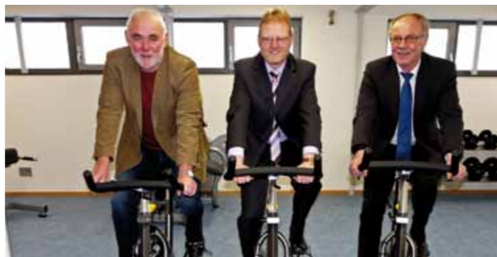
Erhalt der MPS Adorf und Schulsozialarbeit

„Mit mehr als zwei Jahrzehnten Verwaltungserfahrung und einem Netzwerk aus vielen wichtigen Personen auf unterschiedlichen Ebenen, wie aus Ministerien, aus dem Regierungspräsidium und Landkreis habe ich die besten Voraussetzungen für ein Gelingen dieser Vorhaben.“