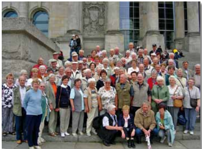
Bei der jährlichen Seniorenfahrt

Der Kontakt zu den Bürgerinnen und Bürgern unserer Gemeinde ist mir wichtig. Um Kommunalpolitik im Sinne der Bürger zu gestalten, ist es für mich geradezu notwendig, Ihre Bedürfnisse zu kennen. Wer mich kennt, weiß, dass ich immer für ein Gespräch zur Verfügung stehe und bestrebt bin, im Einzelfall bei Lösung von Problemen zu helfen.