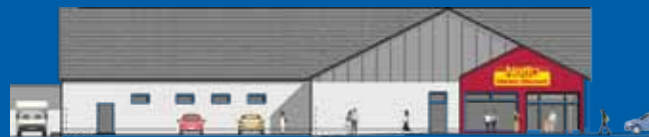
Neubau Nettomarkt in Adorf