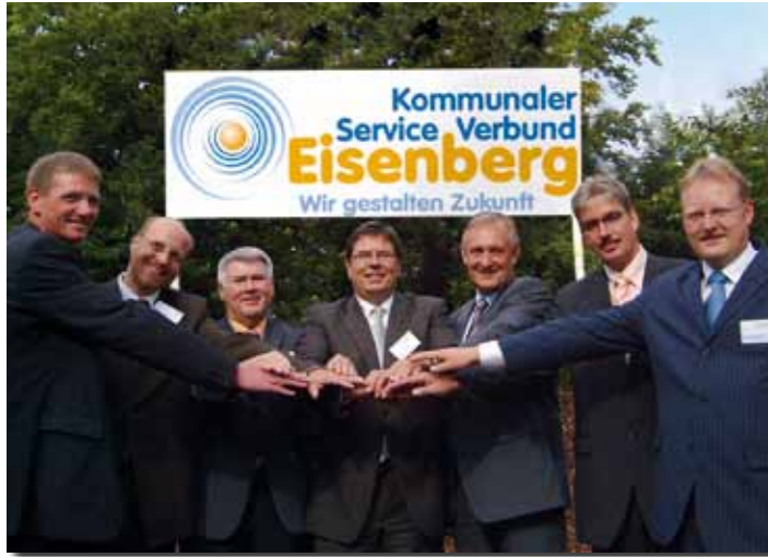
Gründung des Kommunalen Serviceverbundes Eisenberg

Liebe Mitbürgerinnen, lieber Mitbürger, seit September 2005 bin ich als Bürgermeister für die Gemeinde Diemelsee aktiv. Ich bitte Sie um Ihre Stimme bei der Wahl am 27. März, um die begonnene Arbeit fortzusetzen und die Entwicklung unseres Lebensraumes auch in Zukunft mitzugestalten.