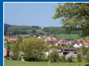
Kanalsanierung in Stormbruch