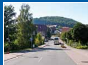
Heringhausen – Straßenausbau Seestraße