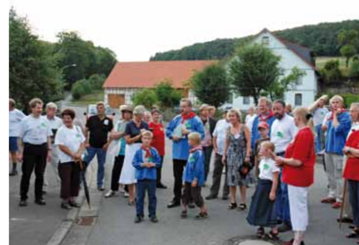
Benkhausen „Unser Dorf hat Zukunft“

Beispiele: Erweiterung des Betreuungsangebotes in den Kindergärten | Sanierung der Kindergärten | Finanzierung der Kindergärten gemeinsam mit der ev. Kirche | Mitwirkung bei der Sicherung des Schulstandortes Adorf und Einführung der Schulsozialarbeit | Ausbau der kommunalen Jugendarbeit | Einführung Familienpass | verbilligtes Bauland für Familien | Kinderuniversität mit dem Kommunalen Serviceverbund Eisenberg | Einrichtung von Jugendräumen in Benkhausen, Deisfeld und Flechtdorf | Mädchenbus und Sonderaktionen für Mädchen | Seniorenfahrt und Seniorennachmittage | Berücksichtigung der Bedürfnisse älterer Menschen im öffentlichen Leben und sehr viel mehr