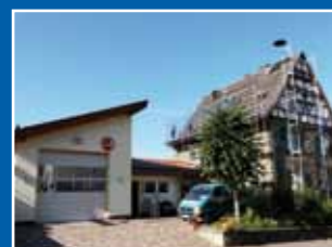
Schweinsbühl – Feuerwehrgerätehaus