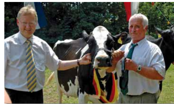
Förderung der Landwirtschaft

Schwerpunkte: Umsetzung des Bedarf- und Entwicklungsplanes der Feuerwehr | Neubau bzw. Sanierung der Feuerwehrgerätehäuser in Adorf, Heringhausen, Schweinsbühl, Vasbeck, Flechtdorf | Beschaffung von diversen Fahrzeugen und Ausrüstungsgegenständen für die Feuerwehren der Großgemeinde und mehr