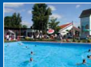
Bezuschussung Freibad Vasbeck