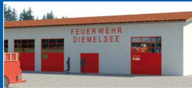
Feuerwehrstützpunkt in Adorf