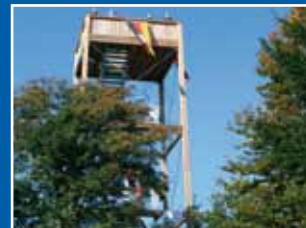
Ortlar – Einweihung neuer Dommelturn